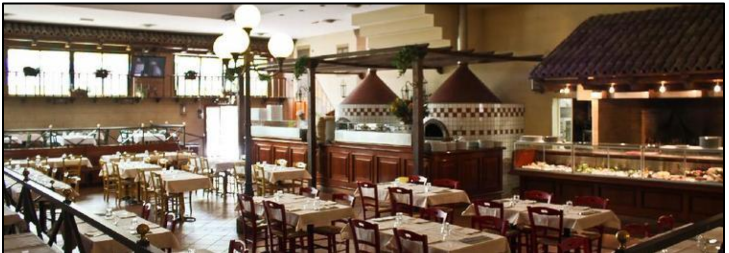
L'interno del ristorante “Pomodoro”